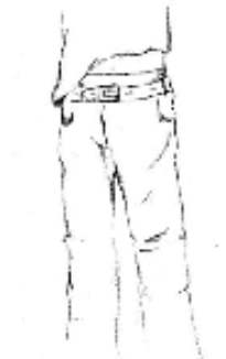
Pantalon trop grand