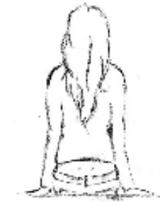
Vêtement couvrant mal