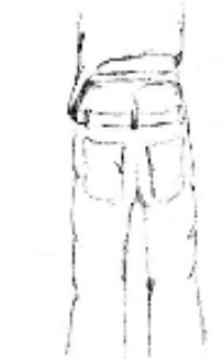
Pantalon laissant voir le boxer