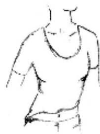
Vêtement couvrant mal