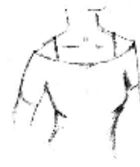
Col bateau avec bretelles