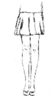
Jupe trop courte