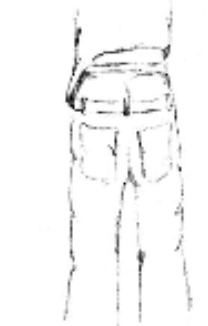
Pantalon laissant voir le boxer