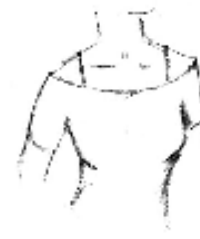
Col bateau avec bretelles