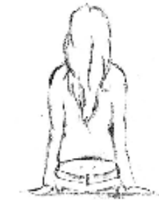
Vêtement couvrant mal